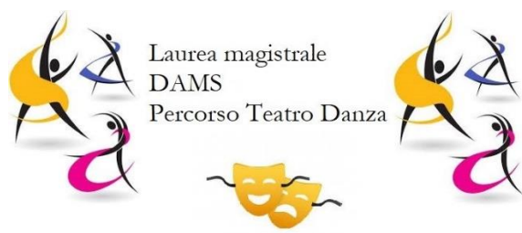
Tabella per la preparazione del piano di studi: