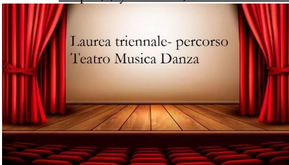
Tabella per la preparazione del piano di studi: